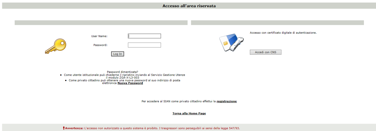
Figura 3 - generalità

A questo punto è necessario inserire le proprie credenziali (username e password) e cliccare sul comando Login. In tal modo, si accede alla pagina con tutti i servizi disponibili in base alle abilitazioni dell’utente stesso, tra le quali “Investimenti vitivinicolo-Gestione Domande Pagamento 2023” .