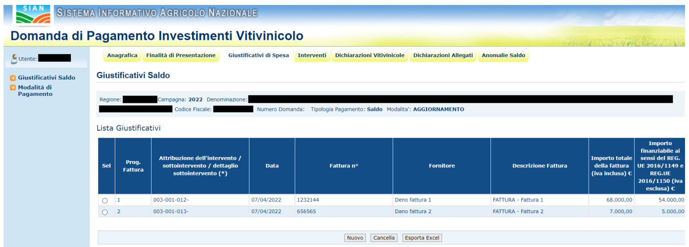
Figura 27 – giustificativi saldo

È possibile inserire le fatture che giustificano le spese sostenute. Il totale delle fatture non può superare il totale di spesa sostenuta indicato in domanda, pena l'accensione della relativa anomalia che non permette la stampa definitiva e il successivo rilascio.