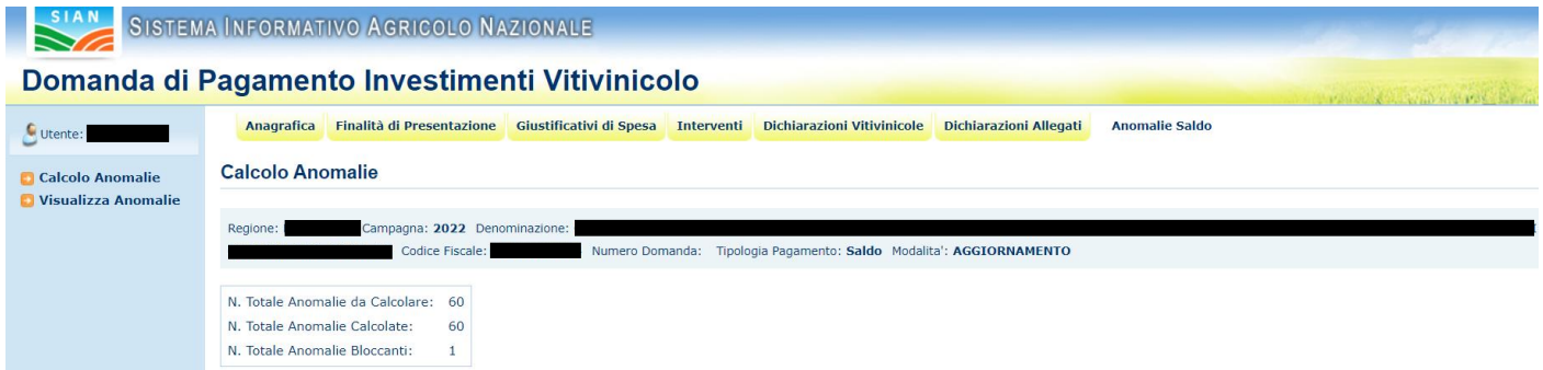
Figura 47 – calcolo anomalie