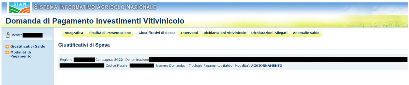
Figura 26 – giustificativi di spesa