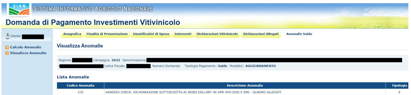
Figura 48 – visualizza anomalie

Visualizza tutta la lista delle eventuali anomalie calcolate a livello di domanda.